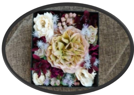
A アーティフィシャルフラワー サイズ:13cm×15cm