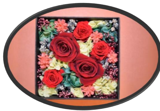
D ブリザーブドフラワー サイズ:11cm×11cm