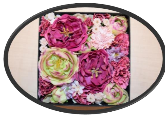
B アーティフィシャルフラワー サイズ:15cm×13cm