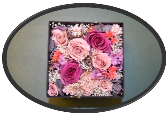
C ブリザーブドフラワー サイズ:11cm×11cm